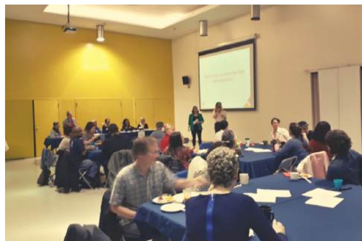
PHOTO: Déjeuner des intervenants au Y des femmes de Montréal

Santé: la Table soutient les efforts visant à améliorer l'accès aux services de santé en participant au comité des usagers du CIUSSS du Centre-Ouest-de-l'Île-de-Montréal.