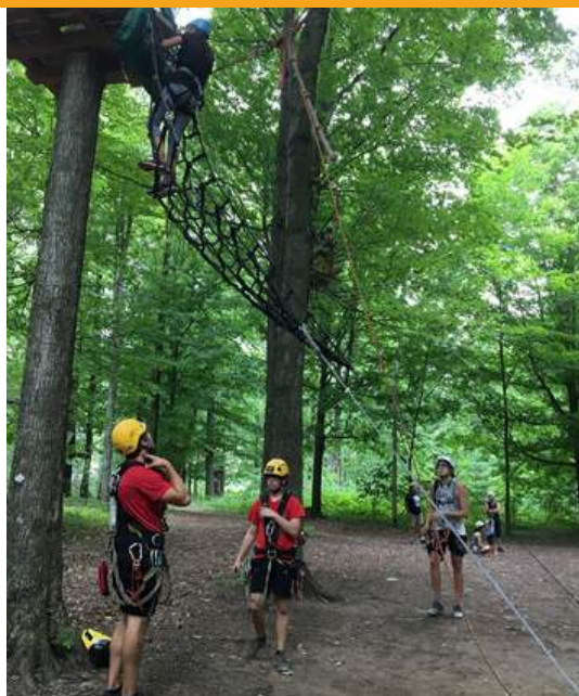
PHOTO: Les jeunes à Arbraska.

80 personnes ont participé aux activités de réseautage et de développement des compétences organisés par le comité pour les intervenant-e-s du quartier (un speednetworking au YMCA centre-ville, un déjeuner-réseautage au Y des femmes de Montréal et une formation sur les réalités et cultures des peuples autochtones).