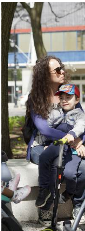
PHOTO: Une petite pause détente au Square Cabot pendant la promenade découverte familiale.