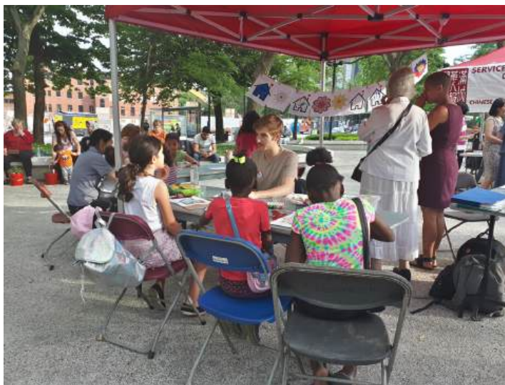
PHOTO: Les enfants bricolent à la fête de quartier estivale au Square Cabot.

Épluchette au Square Cabot ♦ Marché des artisans ♦ Tournée des organismes pour l'Halloween ♦ Carnaval d'hiver ♦ Cabane à sucre au Square Cabot ♦ Fête de quartier estivale