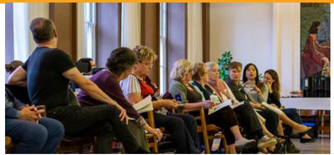
PHOTO: Assemblée de quartier tenue en automne sur le thème des écoles Par Miet Verhauwaert

Nos journalistes citoyen.ne.s ont également publié leurs premières œuvres cette année, incluant des articles, des photos, des balados et même quelques œuvres d'art originales! Nous avons aussi continué d'offrir des ateliers de journalisme, et avons lancé notre projet #humansofpetermcgill, grâce à la collaboration avec le club d'écriture créative d'Innovation Jeunes. Les membres du club et les journalistes se sont interviewés et photographiés les uns les autres, et ont partagé leurs profils sur notre Instagram.