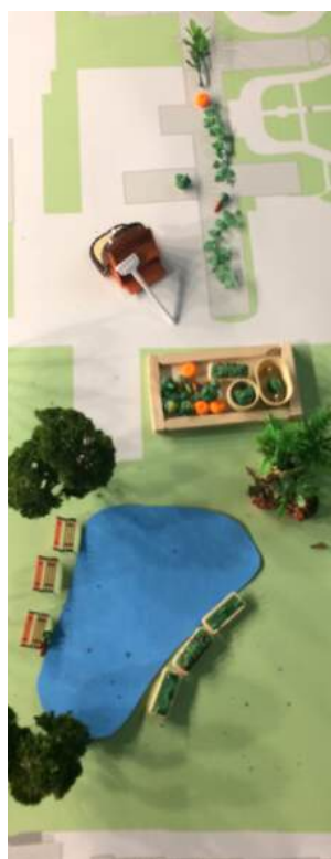
PHOTO: Consultation Imaginons notre espace vert