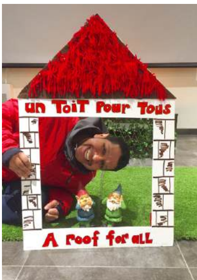
PHOTO: La campagne «Un toit pour tous» dans le café éphémère à Innovation Jeunes!

Nos agentes de mobilisation ont également organisé un café éphémère à Innovation Jeunes lors de la semaine de relâche afin de consulter les jeunes et leurs familles sur la localisation des Airbnb dans le quartier. Les participant.e.s ont également contribué à la campagne «Un toit pour tous», une campagne photo en appui aux demandes de logements sociaux et abordables dans le quartier.