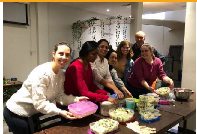
PHOTO: Repas communautaire à Innovation Jeunes pour la semaine de relâche

Le comité s'est basé sur ces orientations pour l'élaboration de son plan d'action et de nouveaux projets concertés pour l'année 2020-21.