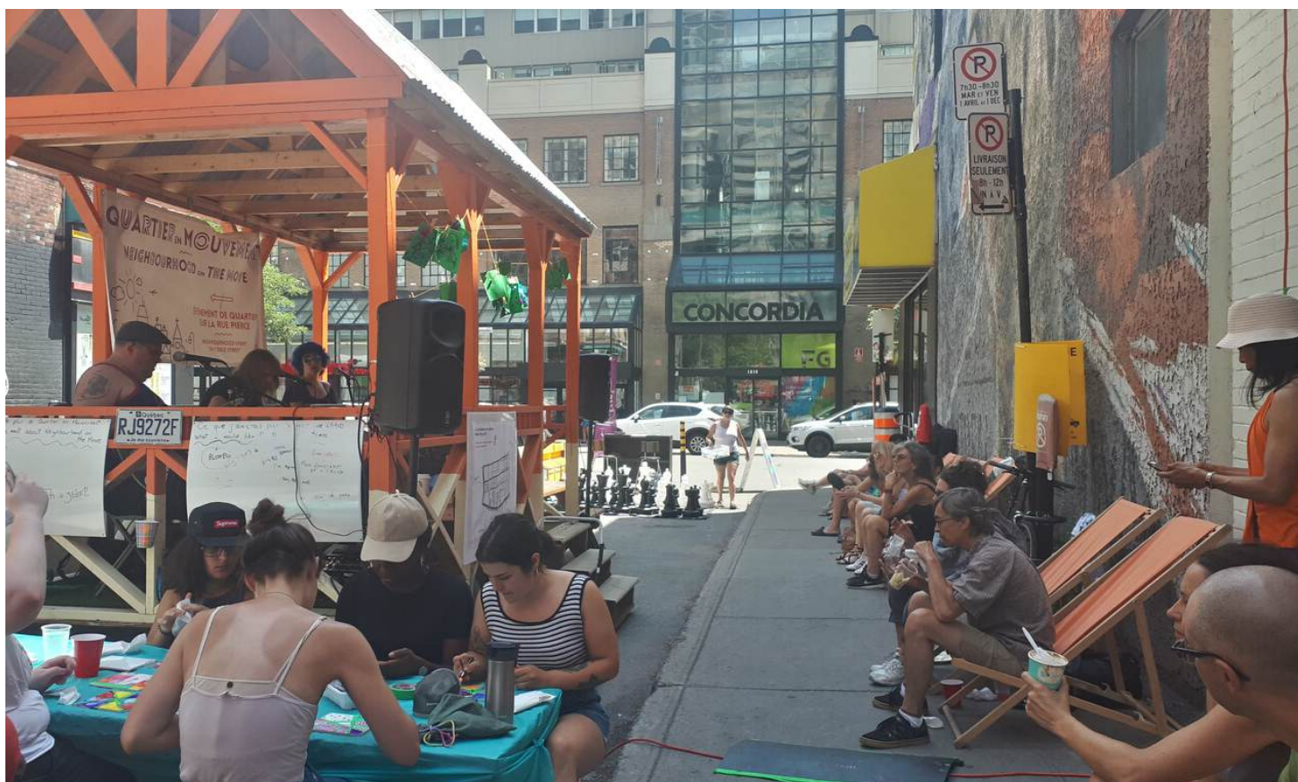
PHOTO: Le festival Quartier en mouvement sur la rue Pierce