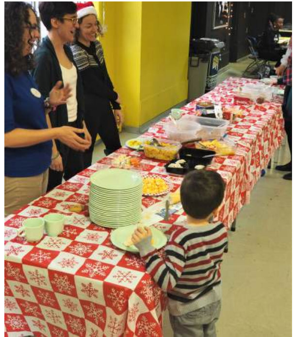
PHOTO: Repas communautaire pour les familles du quartier Par Jean A. Michaël

Le comité Immigration a continué son travail de collecte de données sur les problèmes d'inclusion, en faisant circuler son sondage "Peter-McGill, un quartier accueillant?" pour une deuxième année. Le sondage a obtenu un total de 343 réponses. Une assemblée de quartier avait été prévue pour discuter sur la notion de "quartier accueillant" mais cette activité a dû être reportée à cause de la pandémie. Le comité a aussi partagé de l'information entre les partenaires, incluant une présentation du nouveau portrait de quartier avec un aspect privilégié sur l'immigration.