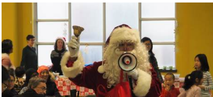
PHOTO: Le Père Noël au repas communautaire du temps des fêtes Par Jean A. Michaël

Le maintien et le développement de la concertation et des services aux familles sera un grand défi dès l'année prochaine, la fin d'Avenir d'enfants étant synonyme d'une coupure de fonds importante. C'est pourquoi, tout au long de l'année 2019-20, Familles centre-ville a participé aux démarches de plaidoyer initiées en collaboration avec toutes les autres concertations en petite-enfance de Montréal pour faire valoir, auprès du Ministère de la familles notamment, l'importance de soutenir toutes ces initiatives qui créent un filet social important pour nos familles. Ces démarches ont, entre autres, mené à la création d'une vidéo de sensibilisation que nous sommes heureux de pouvoir vous partager sur notre site web.